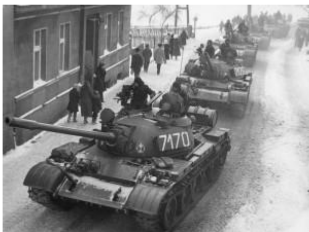
Czołgi T-55 podczas stanu wojennego w Zbąszyniu

120. rocznica urodzin Walta Disneya (1901-1966), amerykańskiego twórcy filmów rysunkowych.