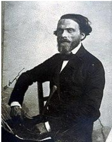
Cyprian Kamil Norwid

470. rocznica urodzin Henryka III Walezego (1551-1589), polskiego króla.